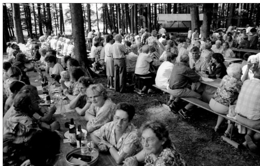
Traditionelles Waldfest im Altisberg im Jahr 1992.

Mit einem tränenden und einem lachenden Auge schaue ich auf die Jahre im MTV zurück. Lachend über die vielen schönen, fröhlichen und kameradschaftlichen Erlebnisse. Trauernd, weil es eine Gemeinschaft, die mir viel bedeutete, von der ich Teil war, in der es mir wohl war – so nicht mehr gibt. Mein Grossvater war einer der Gründer dieses Vereins, mein Vater erlebte ein grosses Wachstum mit ihm – und ich half ihn aufzulösen! Heute geniesse ich das ausgewogene Seniorenturnen für Frauen und Männer am Freitagabend und immer auch den zweiten Teil.