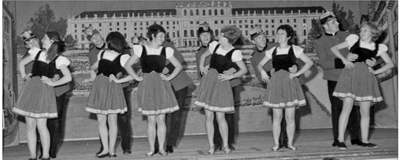
Ausgezeichnete Turnervorstellungen – z.B. «Wien bleibt Wien», aus dem Jahre 1969.