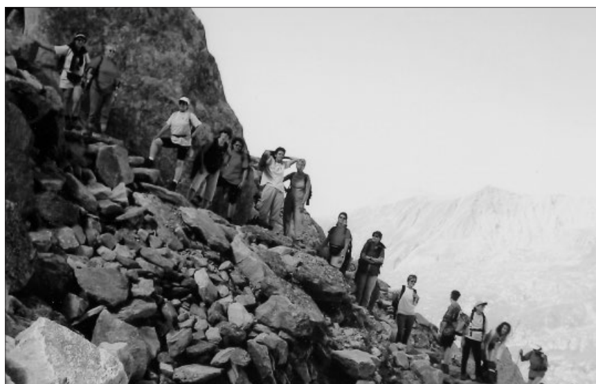
In luftiger Höhe.