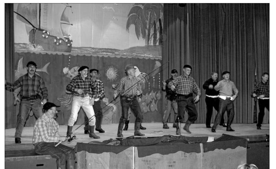
Turnervorstellung 2004 «Alles Acqua oder WAsEr».