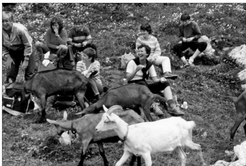
Auch die Ziegen lieben Picknick.