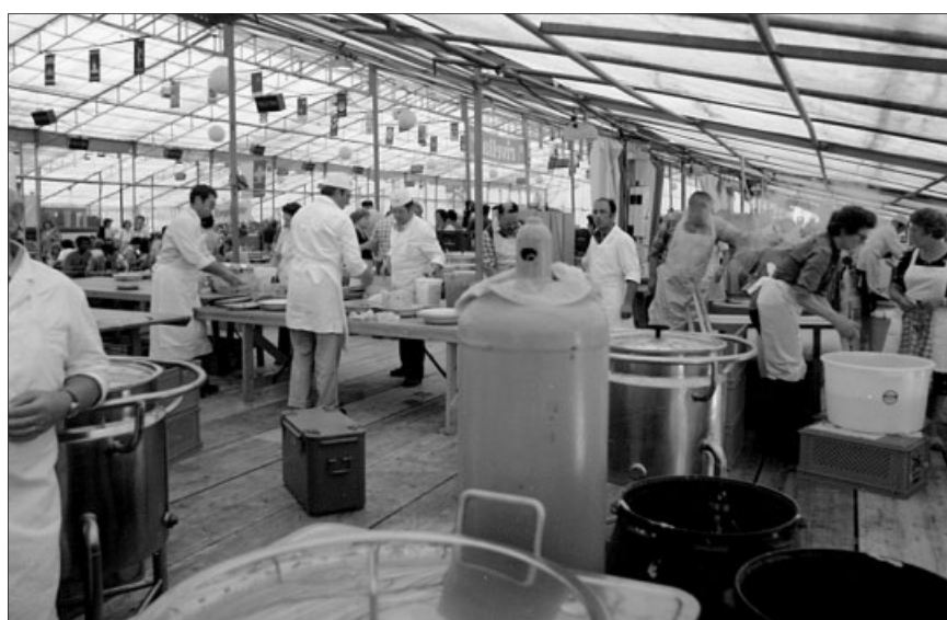
Kantonalturfest Biberist 1982 – am Sonntag wurden in der Festwirtschaft 7000 Mittagessen zubereitet.