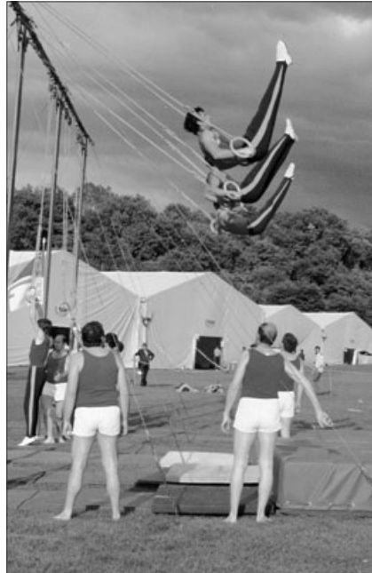
Eidg. Turnfest Genf 1978 – der TVB erreicht den 2. Rang in der 2. Stärkeklasse.

Kurze Zeit vor meinem Eintritt in den TVB hatte eine Gruppe handballbegeisterter Turner die Handballriege ins Leben gerufen. Nebst den ordentlichen Turnstunden an den Ringen und Barren