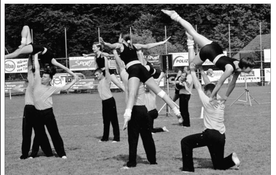
Biberist aktiv!, Kleinfeldgymnastik am Eidg. Turnfest 2002 im Baselbiet.