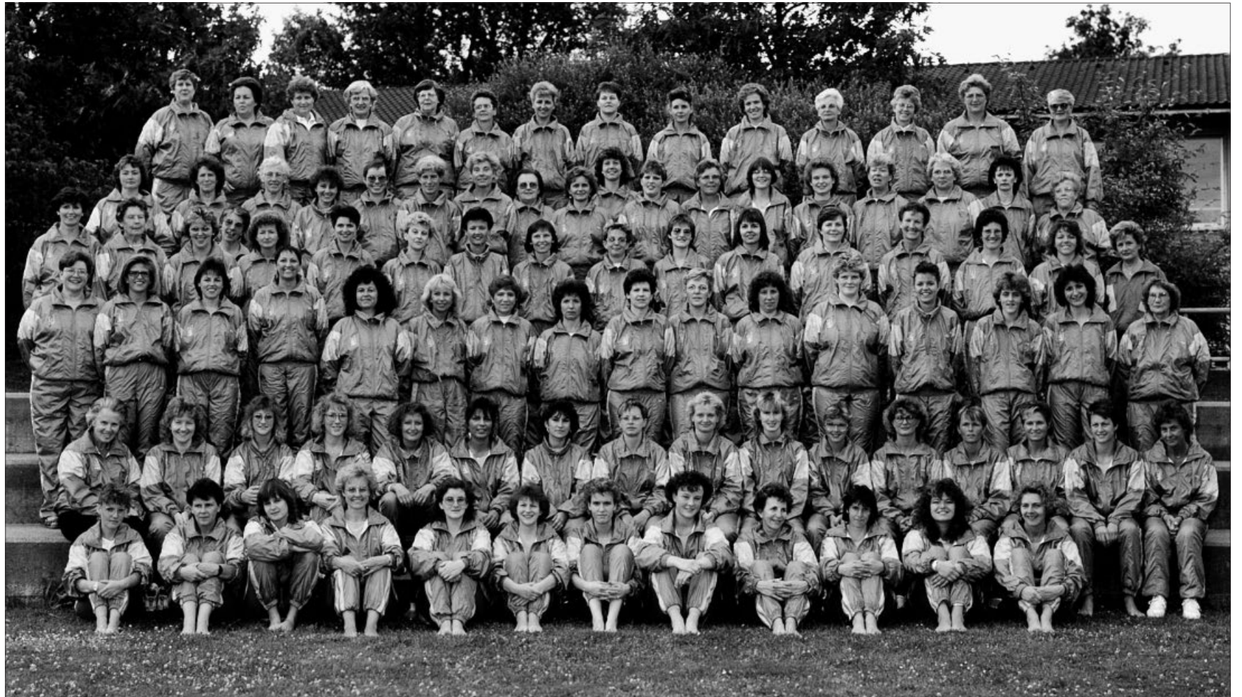
Damenturnerinnen im neuen Trainer im Jubiläumsjahr 1989 – 75 Jahre Damenturnverein.

Themen zwischen dem Prosten und Essen am Frauenabend sind die unzähligen Wanderungen, Skiweekends und Maskenbälle. Bezeichnend für den sozialen Aspekt, dass die Freude darüber fast 40 Jahre später noch existiert, als wäre es gestern gewesen. Man schlief im «Gade» im kleinen Walliser Dorf, unterhielt sich am Abend selber etwa