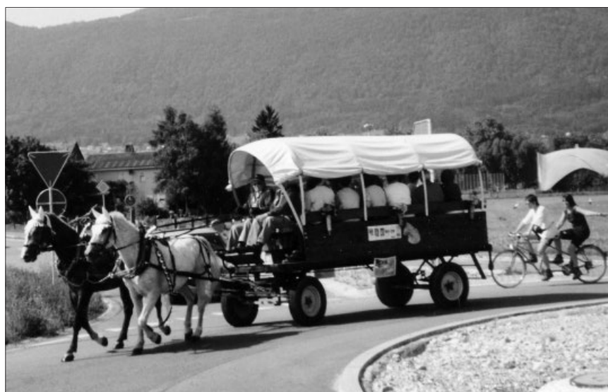
Millenniumsreise, mit Ross und Wagen Richtung Bucheggberg.

Ein Blick in die Zukunft sagt mir, es wird weitere Anpassungen geben, wir sind kein starres Gefüge. Alle vier Vereine haben doch ein und dasselbe Ziel: Biberist aktiv zu erhalten im wahrsten Sinne des Wortes!