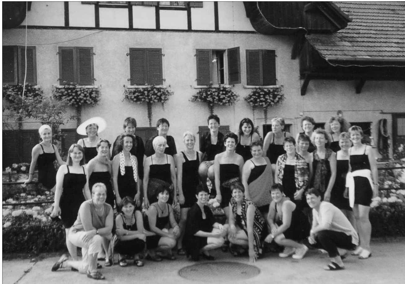
Millenniumsreise, Turnerinnen vor dem Ischhof in Aetigkofen im «Kleinen Schwarzen».

Lieb gewordene Anlässe waren die Frühlingsreise, die Herbstwanderung mit Kind und Kegel und der Samichlaus-Abend. Dafür kreierte Frauen alljährlich wunderschöne Tischdekorationen und genossen ein gutes Essen.