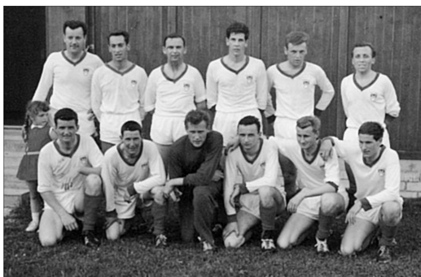
1. Handballmannschaft spielte ab 1965 in der Nationalliga B.

Dorfverein mitgestalten und mittragen zu können, war für mich immer eine Herausforderung. Aber auch die enorme und rasante Entwicklung und die Öffnung im Turnwesen allgemein haben mich geprägt. Verantwortung in einem Verein zu übernehmen und mit allen Konsequenzen durchzuziehen, hat mir auch für den beruflichen Werdegang geholfen. Viele Turngrössen aus Bildung, Politik und Wirtschaft lernte ich im Verlaufe dieser Jahre kennen, und es ist für mich immer wieder beeindruckend, mit welcher Selbstverständlichkeit diese Beziehungen auch Jahre danach gelebt werden dürfen. Leider ist die heutige Zeit viel kurzlebiger, hektischer und kaum mehr nachhaltig. Halten wir alle – Junge, Bestandene und Ältere – am Gemeinschaftsgedanken des Turnsports fest und tragen so zur Erhaltung eines gesunden und attraktiven Biberist aktiv! bei!