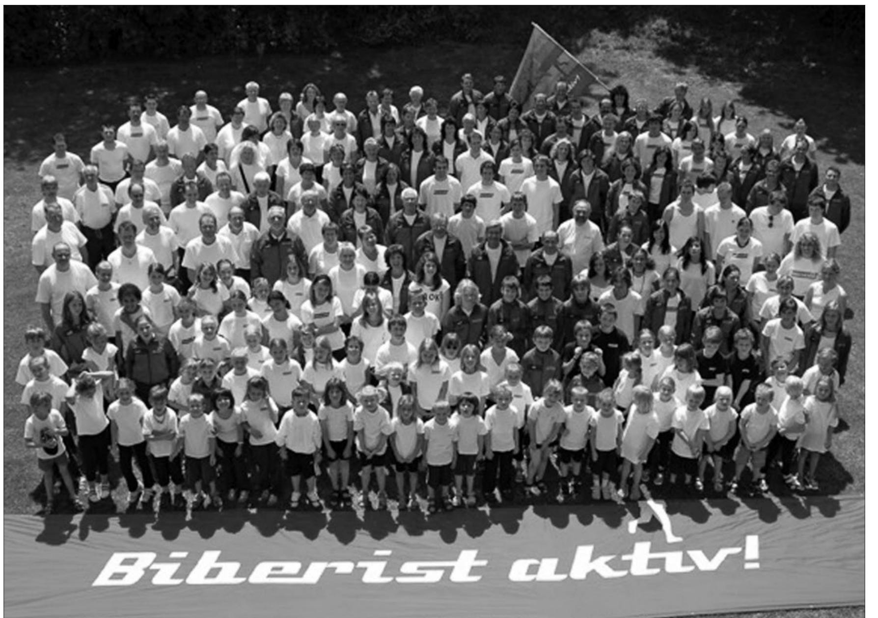
Turnerinnen und Turner im Jahr 2006 vor dem Kantonaltturnfest in Solothurn.

Im selben Jahr baute die Gemeinde das Obere Schulhaus mit der ersten Turnhalle (Geschenk der Papierfabrik, heute «alte Turnhalle») und einem Turnplatz. Die ersten 50 Jahre waren die Zeit der Breitenentwicklung des Turnwesens. Für Jugendliche, Töchter, Frauen, Senioren, Skifahrende und Ge-