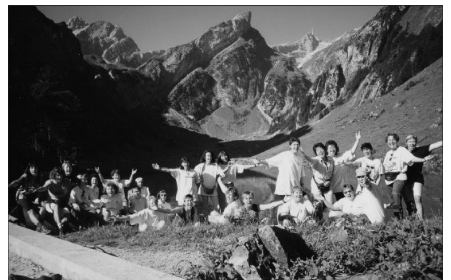
Alljährliche Wanderungen in die Berge.