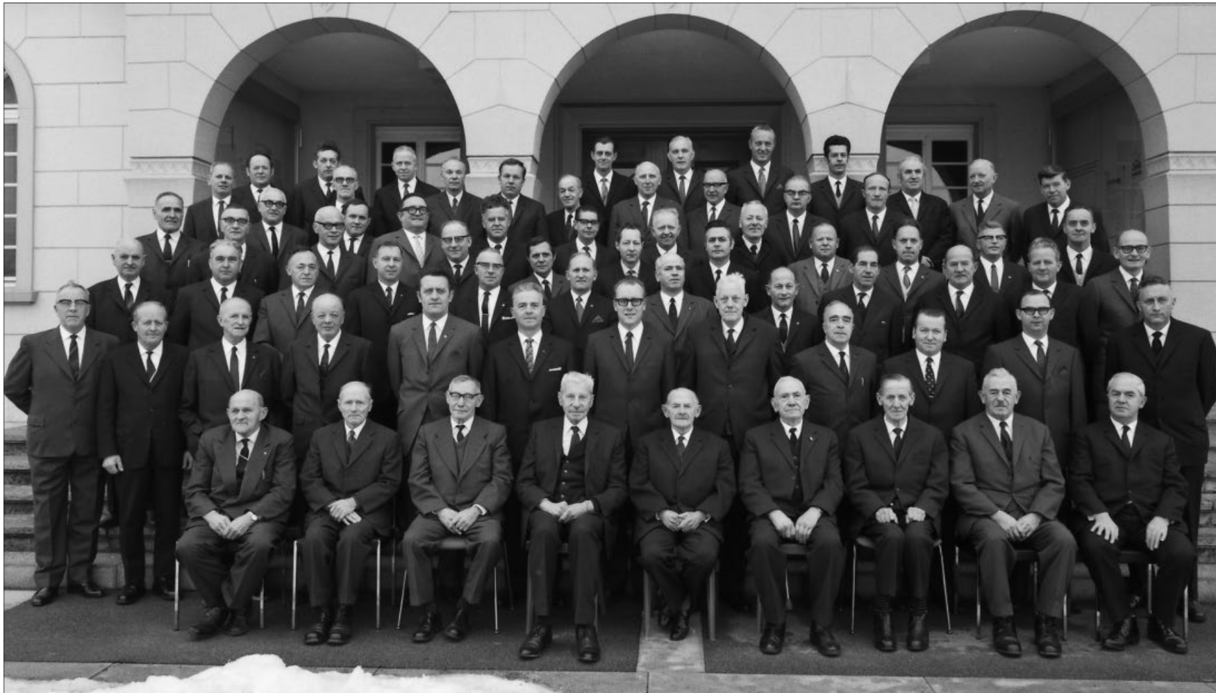
Männerturnverein in festlicher Stimmung am 50-Jahr-Jubiläum im Jahr 1970.

Aufgearbeitet mit der Broschüre «50 Jahre Männerturnverein Biberist» im Jahr 1970