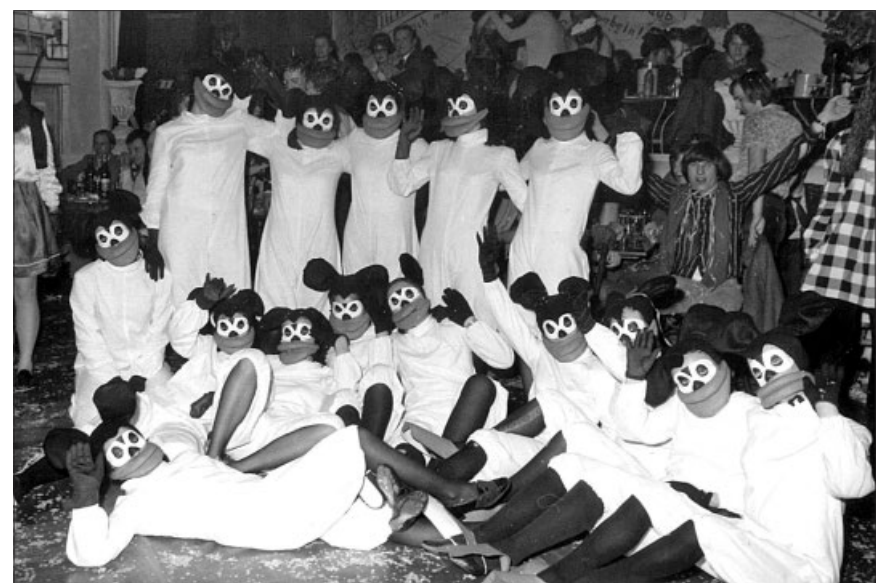
Fasnacht im St. Urs in den 70er-Jahren.