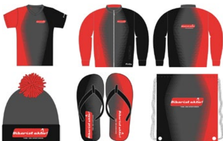
Diverse Custom Produkte von Biberist aktiv!

Der Fachmann für Teamsport in Ihrer Nähe!