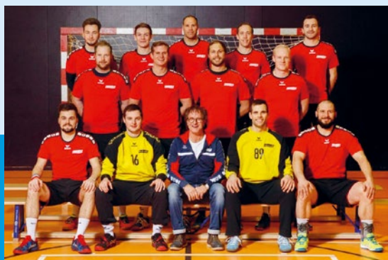
Biberist aktiv! Handball 2019