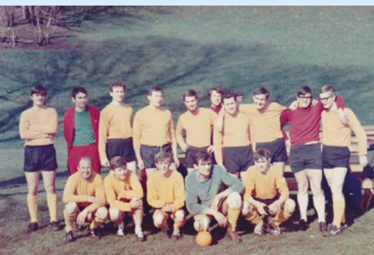
TV Biberist Handball 1969