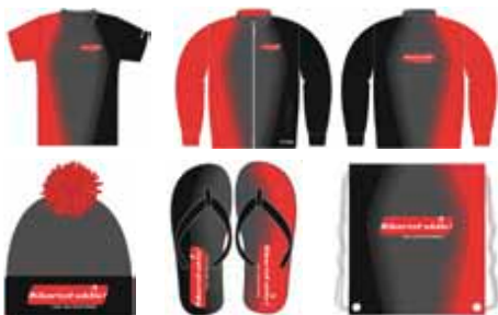
Diverse Custom Produkte von Biberist aktiv!

Der Fachmann für Teamsport in Ihrer Nähe!