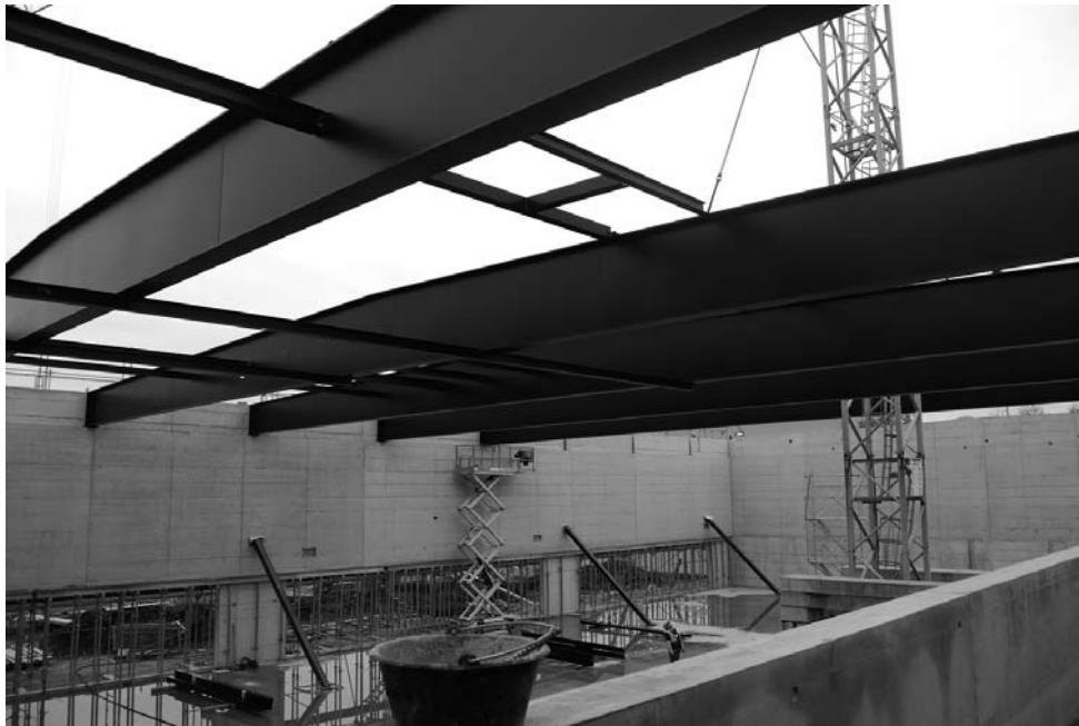
Der fast fertige Unterbau des Daches