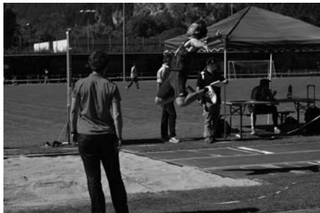
Dänu in der Luft