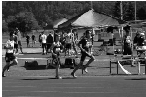
1000m letzte Disziplin

Der Schweizer Final im Leichtathletik-Mannschafts-Mehrkampf (LMM), vom Turnverein Unterseen in Interlaken organisiert, fand bei bestem Spätsommerwetter am 16. September 2012 statt. Unter den 120 Mannschaften mit rund 700 Athletinnen und Athleten waren auch zwei Teams von Biberist aktiv! am Start (Männer und männliche Jugend) und absolvierten umgeben von einer imposanten Bergkulisse einen 5-Kampf. Den Jungs reichte es am Ende für den 9., den Männern für den guten 5. Schlussrang!