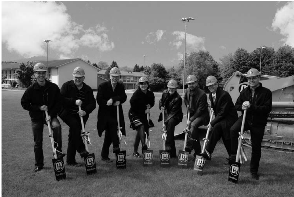
Spatenstich vom 18. Mai 2012

Einweihung der neuen Turnhalle vom 16. bis 18. August 2013 anlässlich eines Dorffestes.