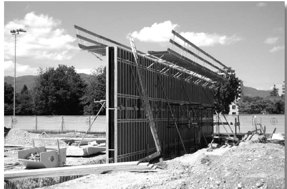
Die erste Wand wird betoniert (Teil des Eingangsbereiches der Sporthalle)