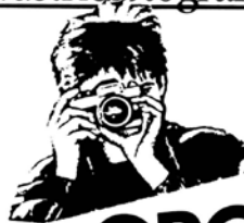
FOTO GROSSEN BIBERIST

Hauptstrasse 30, 4562 Biberist, Telefon 032 672 42 42