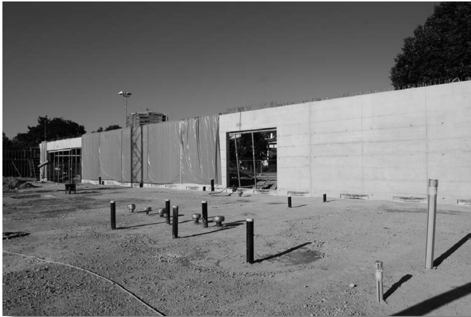
Die Front des Eingangsbereiches ist fertig