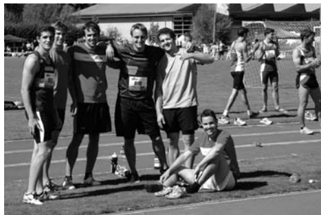
Das alte Team