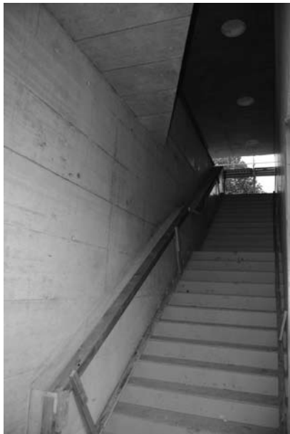
Die Treppe zu den Garderoben bzw. zur Galerie