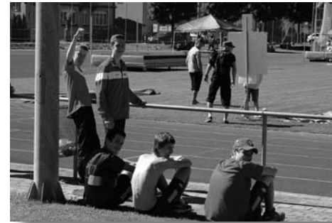
Das junge Team