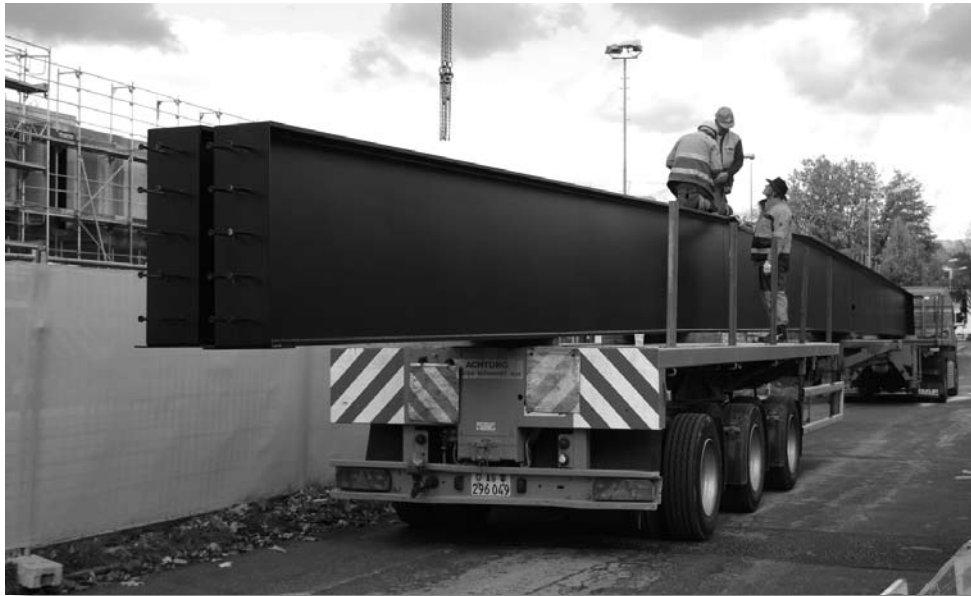
Die Dachträger vor dem Einbau