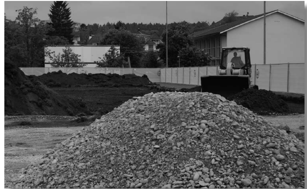
Der Humus wird abgetragen

falkensteinerstrasse 6 | 4710 balsthal | vis-a-vis hotel kreuz