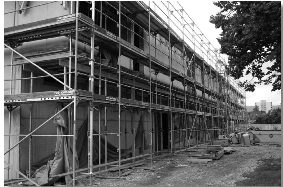
Der zweite Stock ist auch schon betoniert